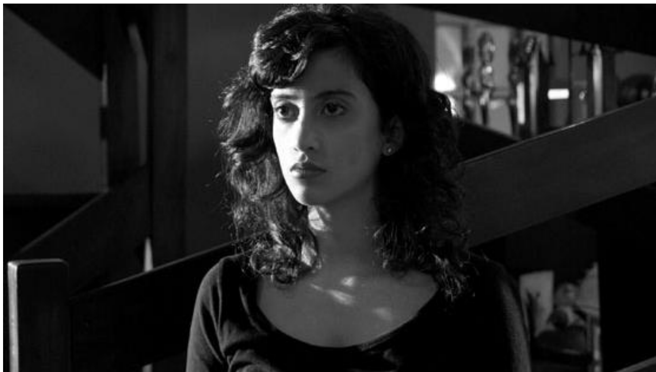
(f) PRIMEIRO PLANO (PP) – A figura humana é enquadrada do peito para cima. Também chamado de "CLOSE-UP, ou "CLOSE".

Enquadramento – se posicione a uma distância do computador (ou celular) de forma que sua imagem na tela tenha o enquadramento de uma foto estilo 3x4 (do peito pra cima), por exemplo. Dessa forma, o plano não ficará tão fechado, destacando apenas o seu rosto. Quem está assistindo quer captar mais que apenas as suas expressões faciais. Não esqueça que seu corpo também fala através dos seus gestos. E assim você torna a troca nesse tipo de comunicação mais agradável.